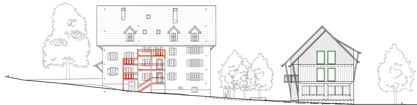
Ansicht Ost Bestand und Ergänzungsbau