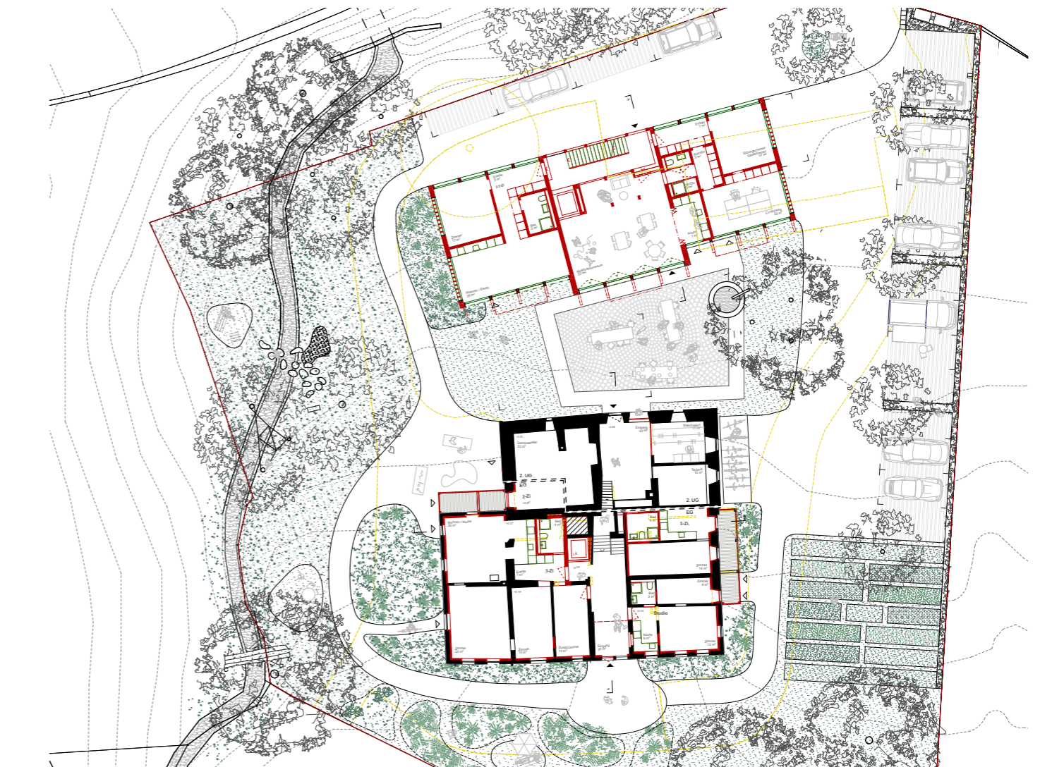
Grundriss mit Umgebung